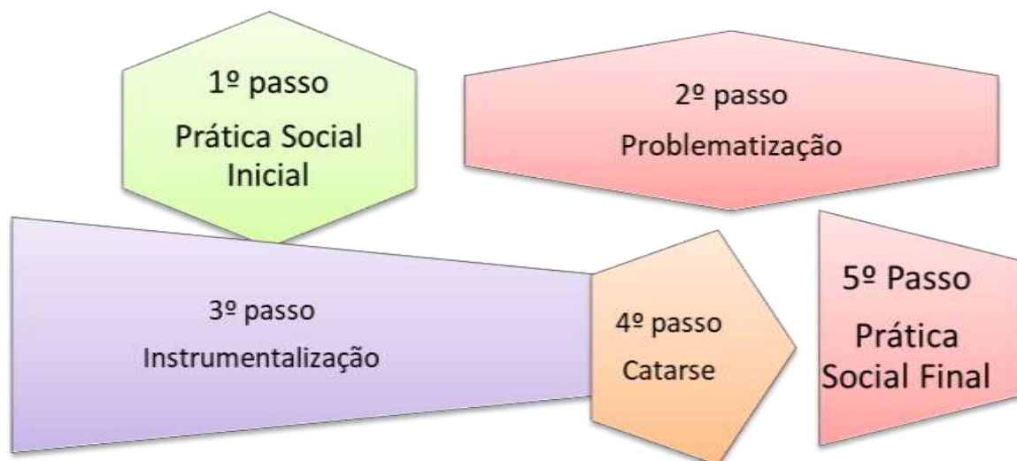
Figura 1 – Cinco passos da pedagogia histórico-crítica, de acordo com Gasparin (2005),

O plano de unidade refere-se ao tema Esportes de Marca que forma um todo completo e que são desenvolvidos no espaço correspondente a dez aulas. Importante notar que a elaboração do plano de unidade contemplou a elaboração de cinco planos de aulas com duas aulas cada.